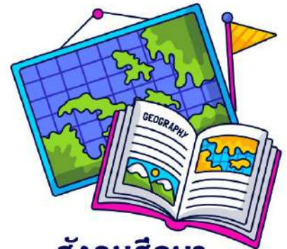
สังคมศึกษา