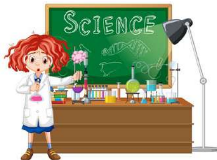
วิทยาศาสตร์