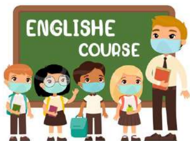
ภาษาต่างประเทศ