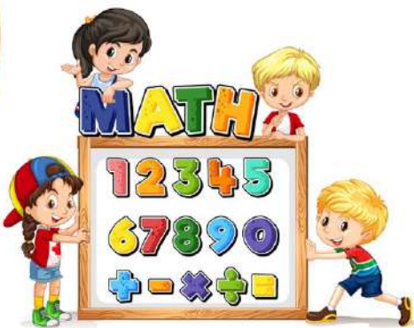
คณิตศาสตร์

เรียนรู้เสริมทักษะความรู้ของนักเรียนโดยสอนตรงเนื้อหาตามหลักสูตร ทุกบทเรียนครบทั้ง 5 วิชาหลัก ภาษาไทย คณิตศาสตร์ วิทยาศาสตร์ สังคมศึกษา และ ภาษาต่างประเทศ โดยเจ้าของภาษา ซึ่งจะเป็นการพัฒนาศักยภาพการเรียนรู้ สามารถนำความรู้ที่ได้ไปประยุกต์ใช้ในชีวิตประจำวัน “เรียนสนุกมีความรู้กลับบ้าน”